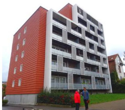
Logement social en bois/paille à St-Dié-des-Vosges (Le Toit Vosgien)